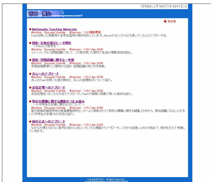
個人のレポートページ(例)

と、入力すると表示されます。自分のページのように扱ってもらえれば、と思っています。